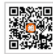
出目金ホームページ [旭レストラン] で検索!